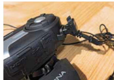
Wetterfeste Langlebigkeit: Sena-Anschlüsse sind wasserdicht und gesichert gegen versehentliches Lösen.

In Sachen Akkulaufzeiten bleibt das 10C zwangsläufig deutlich hinter dem 20S zurück. Video- und Tonaufzeich-nungen kosten ordentlich zusätzlichen Strom und für eine kräftigere Batterie war in dem Gehäuse sicherlich kein Platz