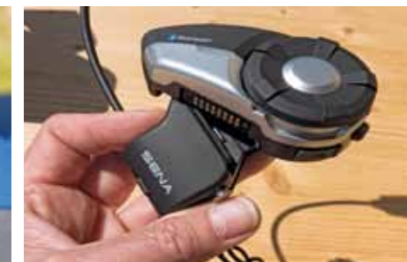
Gelungene Details allerorten: Die Steuerung mittels Drehknopf gelingt super, die drehbare Linse des 10C (links) oder die stabile Eintastenverriegelung beim 20S (rechts) zeigen, dass Motorradfahrer mitentwickelt haben.