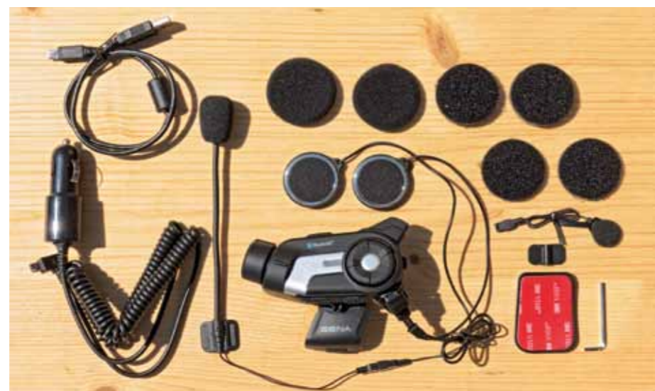
Alles drin, alles dran: Es bedarf nur noch einer MicroSD-Speicherkarte sowie etwas Geduld beim Laden des Akkus, dann kann der kommunikative Videospaß mit dem 10C beginnen.

Ein nur auf den ersten schnellen Blick als Gimmick belächeltes Feature des 10C gewann noch während der Interkom-